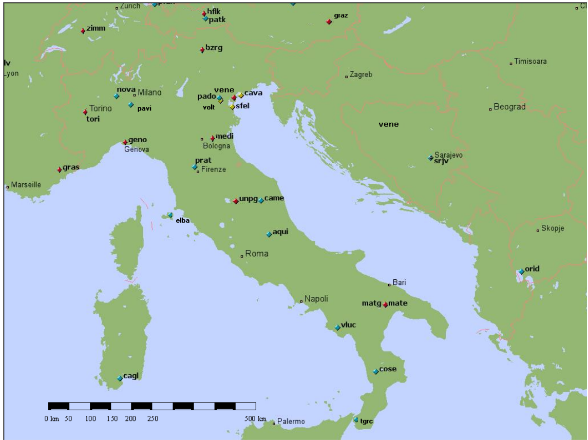
Şekil 2. Uygulamada kullanılan sabit GPS istasyonları [16]

TGO 1.5 yazılımında hesaplanan kartezyen sistemdeki koordinatların karesel ortalama hataları ( m_x, m_y, m_z ), bazın karesel ortalama hatası m_s , koordinat farkları (DX, DY, DZ), baz farkları (S-So), yerel koordinat sisteminde yatay ve düşey bileşenlerin