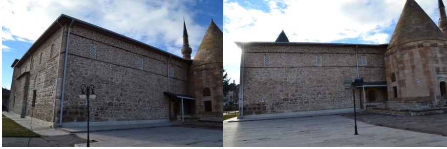
Şekil3. Farklı açılardan çekilmiş fotoğraflar