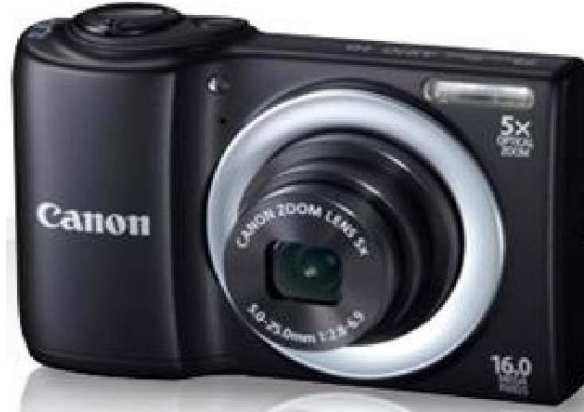
Şekil 2. İnsansız hava aracına entegre dijital kamera

. Fotoğraf makinesinin zoom ayarının oynanmamalıdır.