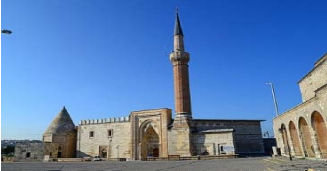
Şekil 1. Eşrefoğlu Camii'nin dıştan görüntüsü

Konya'nın Beyşehir ilçesinde Beyşehir Gölü'nün 100m. kuzeyinde ağaç direkleriyle, ahşap tavanı, minberi ve yüzyılların sükûneti ile görkemli bir ahşap camii olan Eşrefoğlu Camii(31,80x46,55)m ebadındadır. Beyşehir'in önemli tarihi eserlerinden olan Eşrefoğlu Camii (Şekil 1), Konya'ya 72km mesafededir.