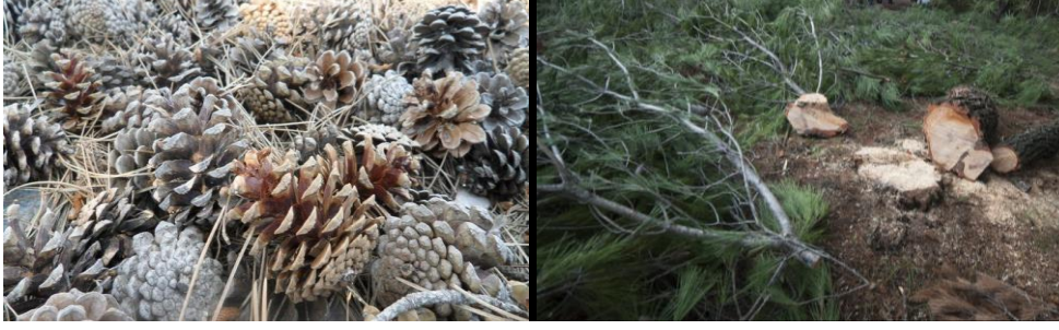
Şekil 1. Çam Kozalağı ve Kesim Sonrası Doğada Bırakılan Tepe ve Dal Artıkları