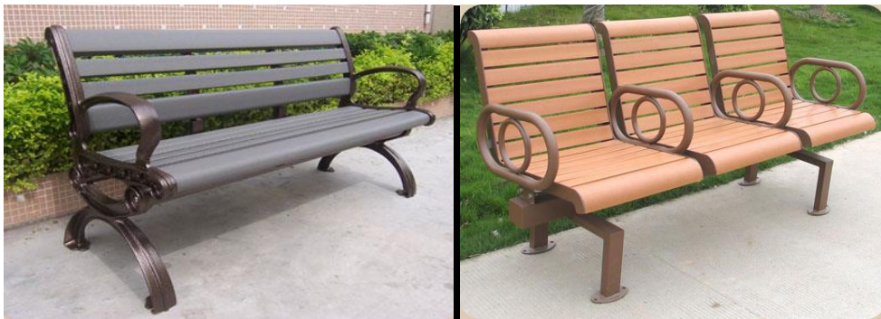
Şekil 5. APK'nın çeşitli kullanım alanları [16]