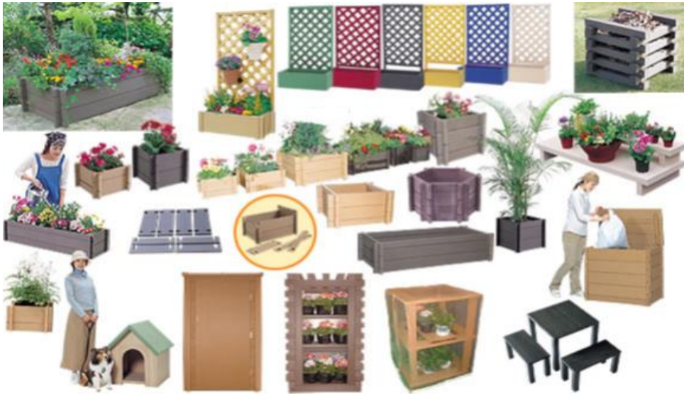
Şekil 4. APK'nın çeşitli kullanım alanları [15]

Dünya çapında birçok araştırma, APK'nın hizmet ömrü ve dayanıklılığına yoğunlaşmıştır. Çünkü bu kompozitlerin kullanımı dış uygulamalarda artmaktadır. Son zamanlardaki konferanslarda böceklerle karşı direnç ve mantar saldırıları, yangın performansı, rutubet özellikleri, ultraviyole ışığını ve sürtünme performansını azaltma konularında çalışmalar yapılmıştır [10].Şekil4.5.6.7'de APK'nın dış mekânlarda kullanım yerleri ile ilgili örnek resimler verilmiştir.