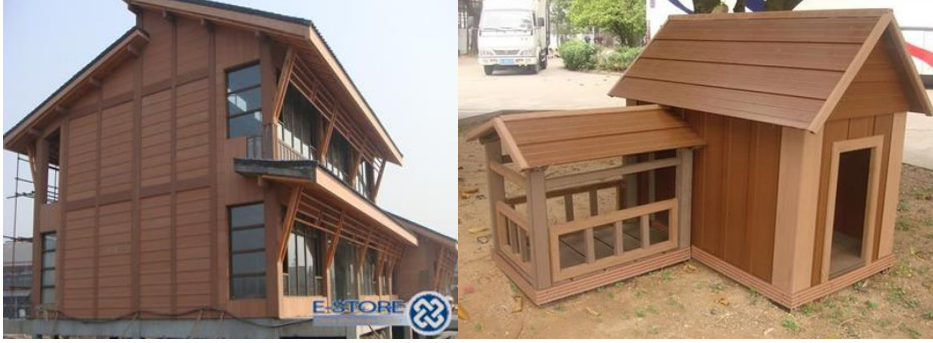
Şekil 7. APK'nın çeşitli kullanım alanları [12-18]