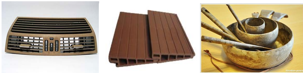
Şekil 2. APK'nın çeşitli kullanım alanları [12]

Bununla birlikte mekanik özellikler, örneğin eğilme direnci, çekme direnci masif ahşaba göre daha düşüktür. Bu nedenle APK kompozitler halen dikkate değer bir yapısal performans gerektiren uygulamalarda kullanılmamaktadır. Şekil 3'de Avrupa'da APK ürünlerin piyasa yüzdesi görülmektedir. Tablo 1'de APK kullanım alanları görülmektedir.