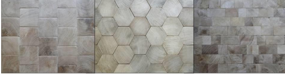
Şekil 3. Enkesit parke örnekleri (farklı kesim şekillerine göre) [14]

yıllık halkaları görmek mümkündür ve uzunlamasına kesilen plakalardan tamamen farklı bir görüntü vermektedirler. Ayrıca, enkesit malzemeler birçok küçük kare veya dikdörtgen bloktan oluşmaktadır ve uzunlamasına levhalar değildir [13] (Şekil 3).