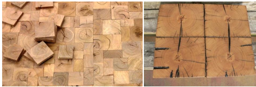
Şekil 4. Enkaz malzemelerin enkesit parke olarak kullanımı

Enkesit malzeme kullanımında daha önceden kullanılmış ve sökülerek atılacak olan kerestelerde (enkaz) kullanılmaktadır (Şekil 4) [16, 17].