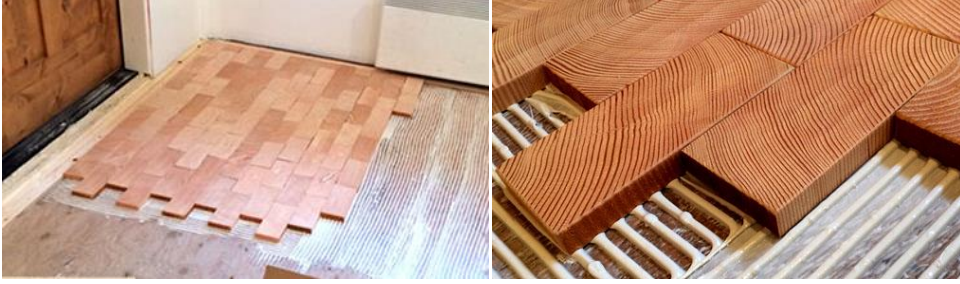
Şekil 5. Enkesit parkelerin zemine tutkallanarak yapıştırılması [18]

Enkesit parkeler çivi ve taban döşemesi olmadan şap beton üzerine doğrudan tutkallanarak döşenmelidir (Şekil 5). Parkeler önceki sıraya elle ittirilerek döşenmeli herhangi bir baskı malzemesi kullanılmamalıdır (Şekil 6) [13].