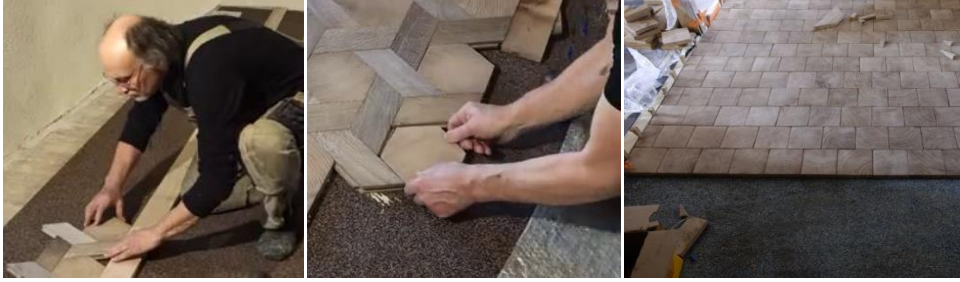
Şekil 6. Enkesit parkelerin astar zemin üzerine döşenmesi [19]

Şapın altında uygun rutubet ayırıcı koyulduğundan emin olunmalıdır. Alt taraftan/zeminden nemin yavaş fakat sürekli absorpsiyonu/emilimi geri dönülemez şişmeye ve parkelerin kalkmasına/kabarmasına yol açar. Rutubet konusunda tereddüt edildiğinde su geçirmez bir epoksi astar (rutubete karşı iyi bir koruma sağlayan ve şapı kuvvetlendiren Sikafloor MB gibi) uygulamak daha iyidir (Şekil 6). Şap kalitesi çok önemlidir ki küçük bloklar tarafından oluşturulan kuvvetlerden dolayı üst yüzey bozulmaz. İki yüzey arasında dengelenme/uyum vuku bulduğunda zemine bağlanma mükemmel olmaktadır. Sikafloor MB astarı ile uyumlu olan Sikabond poliüretan tutkalı enkesit parkeleri zemine döşemek için çok uygundur. Bu tutkal çok kuvvetli yapışma