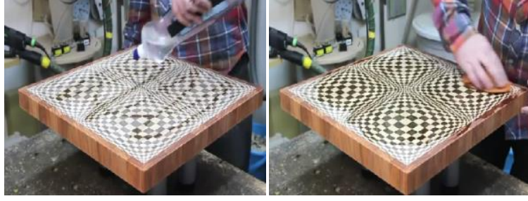
Şekil 8. Yüzeyin yağ ile işlem görmesi (örn. Enkesit masa tablası) [21]