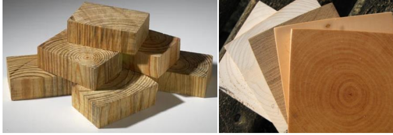
Şekil 1. Enkesit malzeme örnekleri [10, 11]

Odun liflerine dik olarak kesim sonrası elde edilen malzemeler/parkeler enkesit döşeme malzemesi veya enkesit parke olarak ifade edilmektedir (Şekil 1).