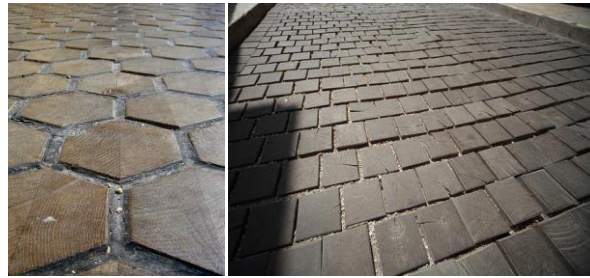
Şekil 2. Cadde ve kaldırımlarda kullanılan enkesit malzeme [12]

Enkesit malzemenin yer karosu ve kaldırım taşı gibi kullanımı yüzyıllar öncesine dayanmaktadır. İlk olarak altıgen veya yuvarlak şekillerde kaldırım ve yollarda kaplama malzemesi olarak kullanılmıştır. Özellikle 19. Yüzyıl ve 20. Yüzyılın başlarında, Avrupa, Amerika ve Rusya'da birçok kasaba ve şehir sokakları ve kaldırımları enkesit malzemeler ile döşenmiştir (Şekil 2) ki bu atlar ve demir jantlı vagonlar için ideal bir yüzey sağlamaktadır [10].