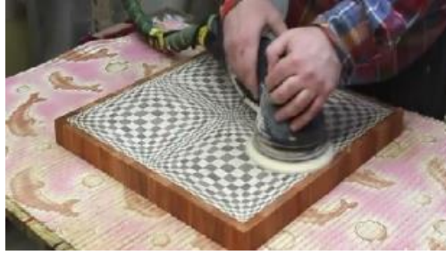
Şekil 7. Yüzeyin bez zımpara ile parlatılması [20]

Parke bloklarının kalınlığı büyük bir hassasiyetle kesilmelidir. Düz bir zemin üzerinde yeknesak/uniform bir döşeme için zımparalamayı minimum tutmak çok önemlidir. Bu parkelerin sertliklerinden dolayı, 1 mm'lik bir zımparalama çok zor bir iştir. Zımparalama bant zımparalama makinesi ile yapılır. Granül/tanecikler yüzeyde düzensizliğe sebep olacaktır. Bu nedenle zımparalama granül inceliği kademeli artırılarak devam ettirilmelidir (iki adımda 40 numaradan 80 numaraya atlanmamalıdır). En sonunda parkeler 120 numaralı bez (gauze disk) zımpara ile parlatılmalıdır (Şekil 7) [13].