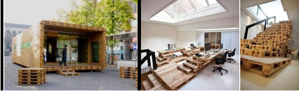
Resim 24.25.26. Palet Evi, Gregor Pils, Andreas Claus Schnetzer, Viyana, (URL-15); Brandbase, Most Architecture, Rotterdam, 2010 (URL-16)

Most Architecture, BrandBase ofis projesinde, merdiven ve ofis çalışma birimlerinin tasarımlarında paletleri kullanmıştır. Farklı işlevler içi, farklı büyüklüklerde paletler, renklendirilerek tasarlanabilmektedir. (Resim 25.26)