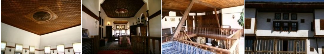
Resim 1.2.3.4. Asmazlar Konağı ve Hatice Hanım Konağında ahşap kullanımı, Safranbolu

Ahşabın iç ve dış mekanda geleneksel kullanımına en iyi örneklerden biri Türk Evidir. Geleneksel Türk evinde, ahşap strüktürel bir malzeme olarak kullanılırken, iç mekanda ve cephede özgün biçimlenmeler yaratmıştır. Ahşap iç mekanda yatay hatlarla, mekanı insan ölçeğine indirgerken, insanı saran sıcak bir atmosfer de oluşturmaktadır. [3] (Resim 1-4)