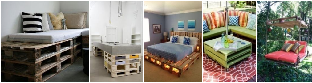
Resim 27.28.29.30.31. Farklı işlevler için tasarlanan paletler (URL-17)