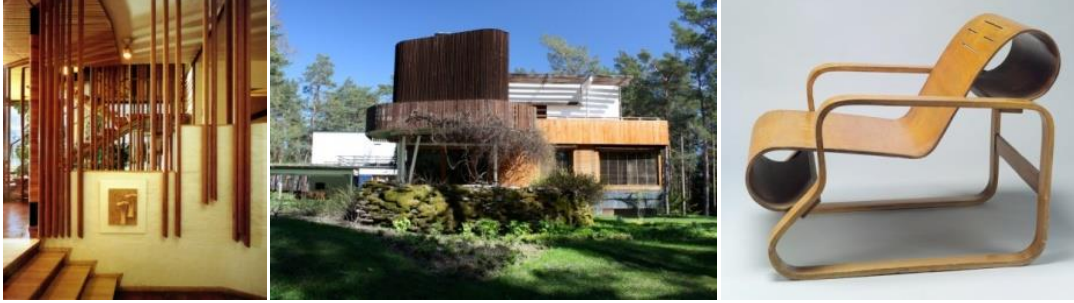
Resim 5.6.7. Villa Mairea, Alvar Aalto, Finlandiya, 1937(URL-1); Paimio Chair, 1931-32, Finlandiya(URL-2)

Senatoryumu için tasarladığı oturma birimlerinde dik açılardan, keskin hatlardan kaçınmıştır. Paimio Chair’da, katlanmış kontraplak ve eğrisel formlarda bükülen ahşapla yeni bir form oluşturmuştur. [5] (Resim 5-7)